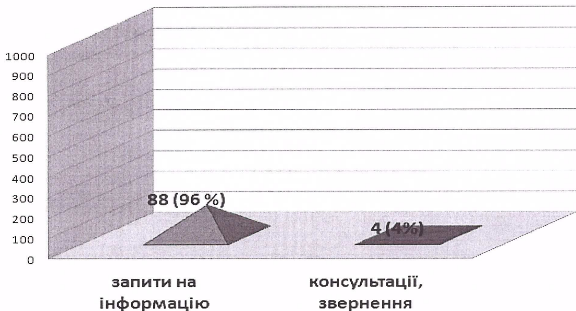
Інформація щодо результатів попереднього розгляду документів на отримання публічної інформації станом 31.01.2022 року